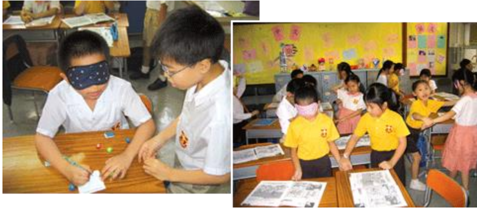
另一個世界—同學戴上眼罩體驗視障人士日常所遇到的困難