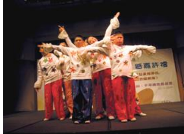
無分你我——一群傷健兒童齊踏台板