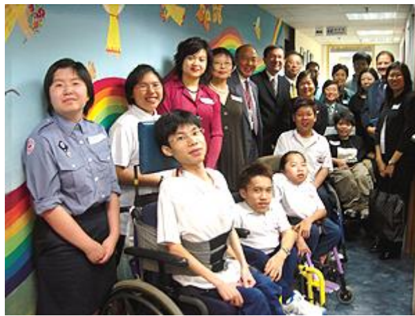
同賀平等機會委員會成立九周年！甘迺迪中心的師生與委員會委員在「大同世界」壁畫前留影，該畫是甘迺迪中心學生於一九九七年慶祝委員會成立一周年的創作。