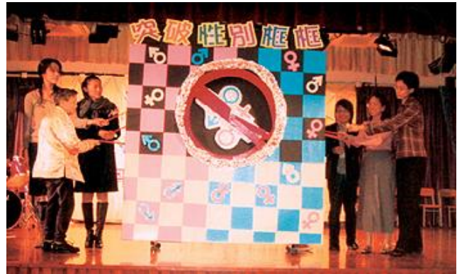
打破性別定型，開拓新視野