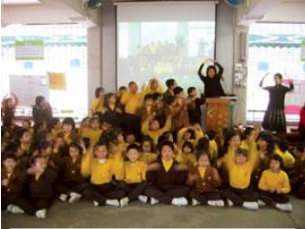
搞搞新意思——學習手語令這群學童雀躍不已

為了凝聚社區動力，共同推廣平等機會觀念，委員會自 1997 年起資助了超過 450 個非政府組織、社區團體和學校，舉辦各類活動，宣傳反歧視。一如以往，今年的「平等機會社會參與資助計劃」吸引了大批參加者，委員會特此向各主辦機構致謝！