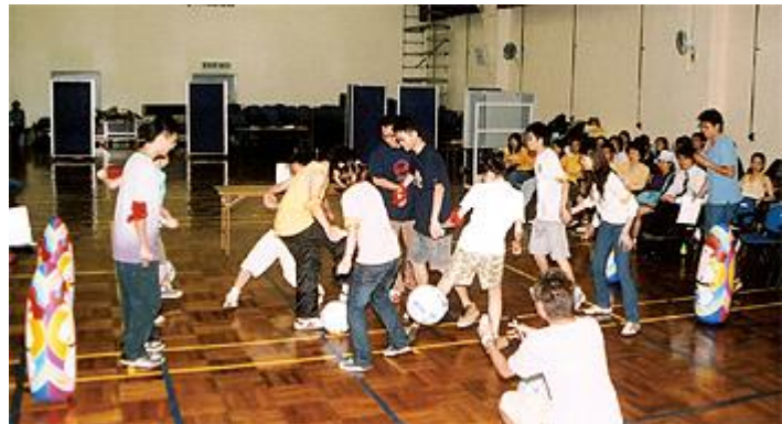
參賽隊伍示範生動有趣的遊戲，以加強男女平等觀念及提高性別意識。