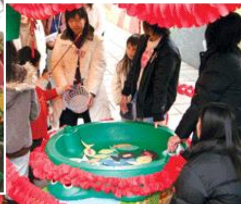
攤位同樂：透過遊戲增加對發展障礙的認識