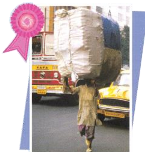
季軍：傅俊偉 貢獻社會 無分你我