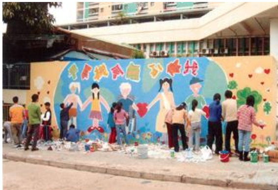
B 同創好明天——一幅以「平等機會 無分你我」為題的壁畫剛剛完成