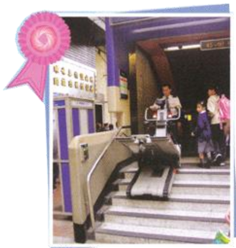
季軍：成灝志 都市坦克—協助輪椅人士 落樓梯的輪椅輔助車